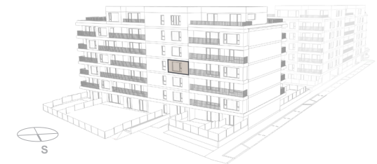
POHLED - BUDOVA B