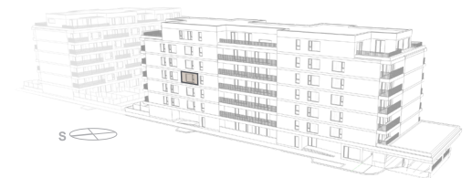
POHLED - BUDOVA A